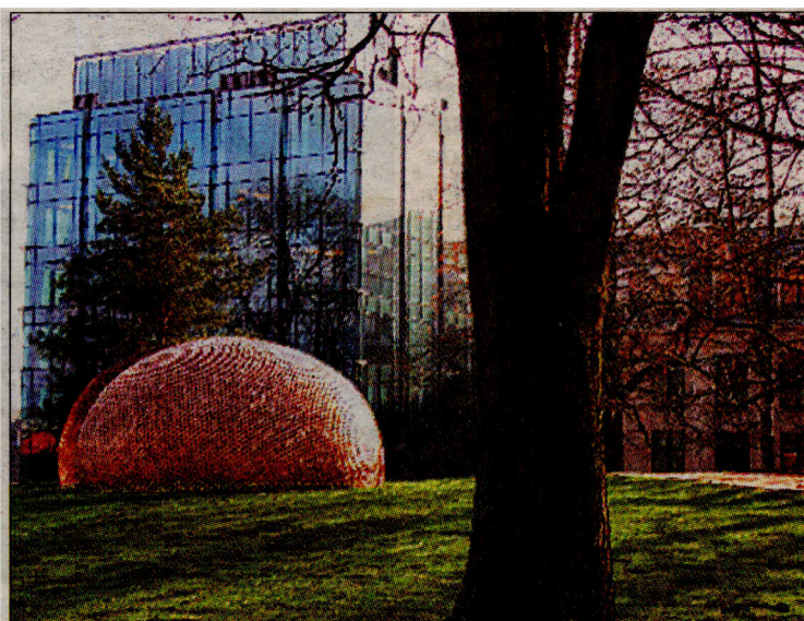
«Le passe-muraille» du parc Pescatore s'inspire du passé de l'ancienne ville-forteresse et se situe juste au-dessus d'anciens bastions

Né au Mans en 1954, Jean-Bernard Métais réalise depuis plus de 20 ans des œuvres à travers le monde. Son travail sculptural est essentiellement basé sur l'expérimentation des lieux qu'il investit.