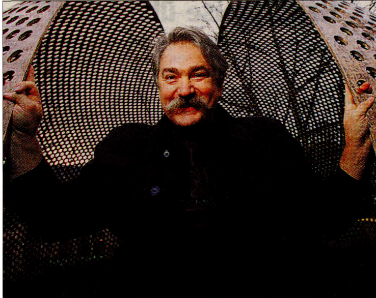
Die Skulptur „Passe-muraille“ von Jean-Bernard Métais lässt den Geist einer Verbindung der historischen Geschichte des Untergrundes mit der Gegenwart entstehen.