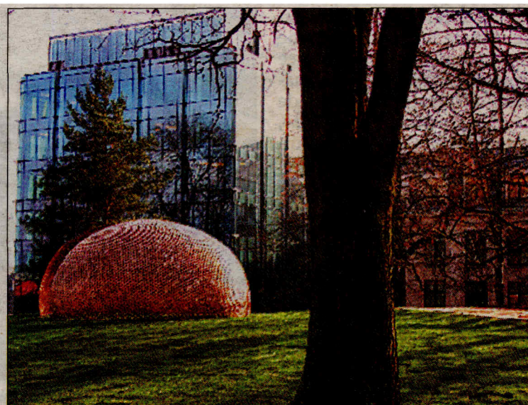
«Le passe-muraille» du parc Pescatore s'inspire du passé de l'ancienne ville-forteresse et se situe juste au-dessus d'anciens bastions